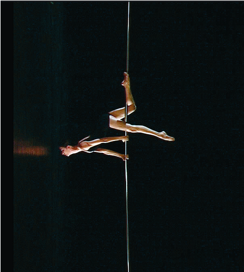
השיעור. עבודה של מיכל הלפמן